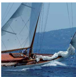
Avenir Vie Plus