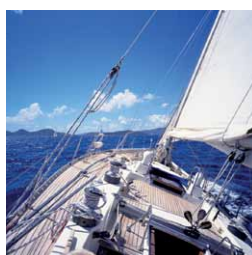
Capitalisation Vie Plus