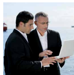
Sérévi Homme Clé et Associés