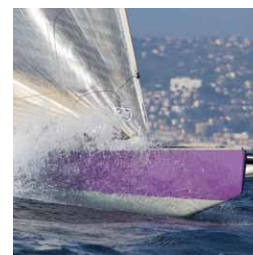
PEA Vie Plus