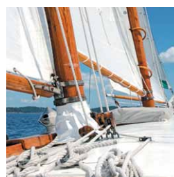
Patrimoine Vie Plus